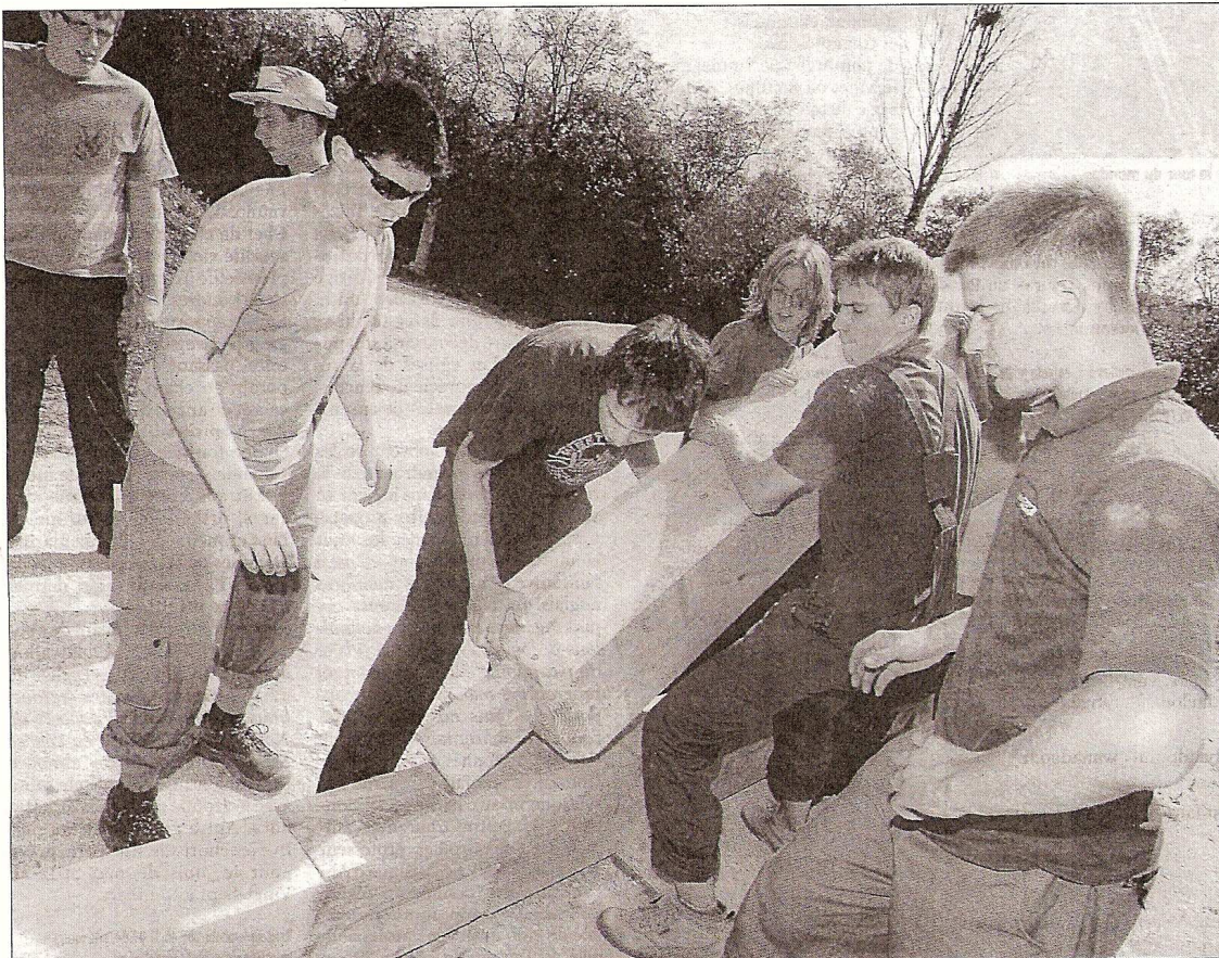
Les jeunes charpentiers tchèques sont à l'œuvre jusqu'au 27 septembre à Salles-de-Villefagnan.